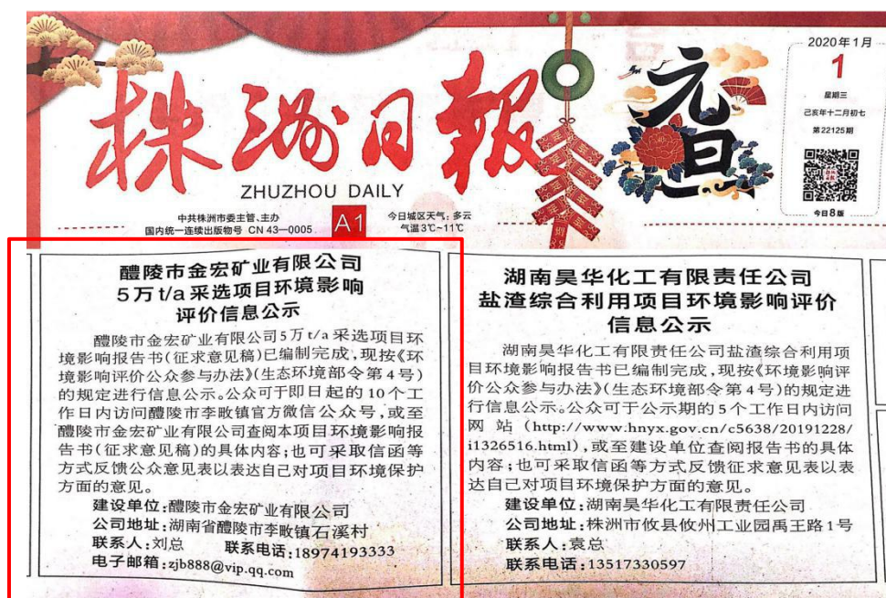
图 3 第一次报纸公示照片

众参与办法》（生态环境部令 第 4 号）中第十一条中“通过建设项目所在地公众易于接触的报纸公开，且在征求意见的 10 个工作日内公开信息不得少于 2 次”的要求。本公司于 2020 年 1 月 1 日和 2020 年 1 月 2 日通过报纸公示的方式进行两次了本工程环境影响报告书征求意见稿公示，公示报纸为《株洲日报》2020 年 1 月 1 日第 22125 期和 2020 年 1 月 2 日第 22126 期，《株洲日报》是项目所在地发行量较大、公众易于接触到的报纸，且在征求意见的 10 个工作日内登报公示了 2 次，符合《环境影响评价公众参与办法》的要求。