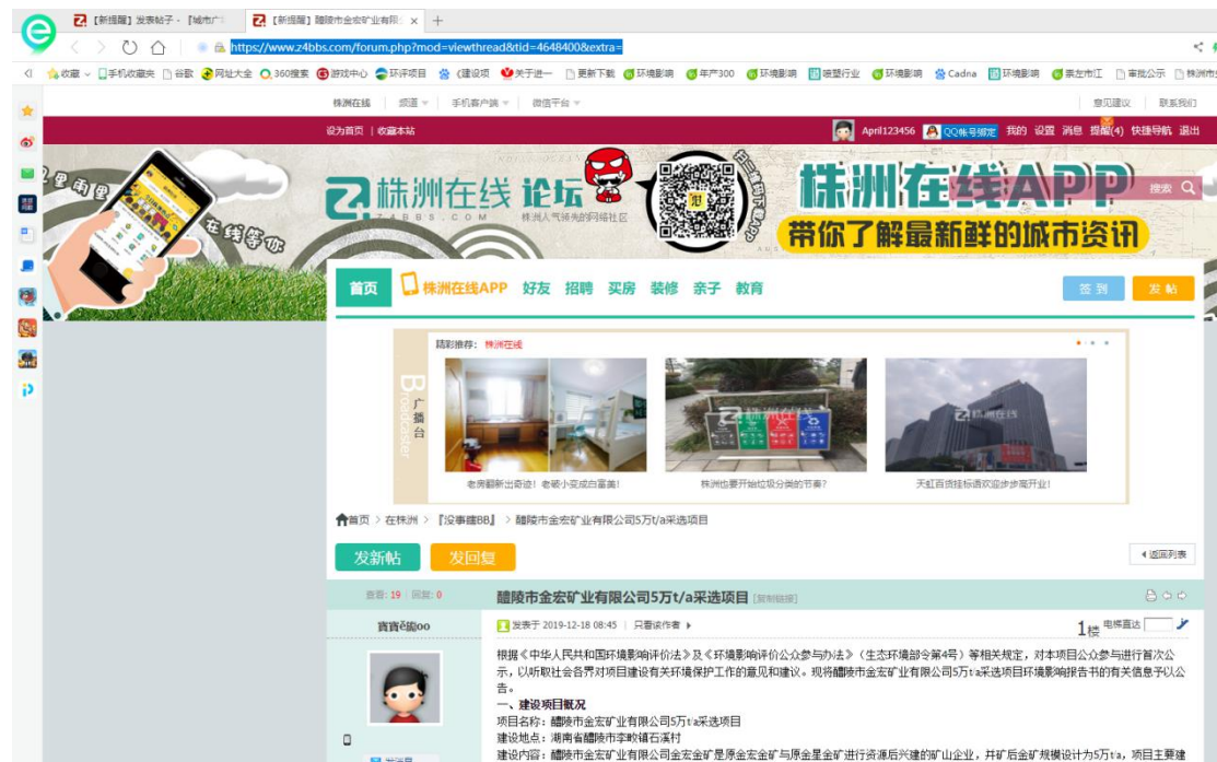
图 1 首次网络公示截图

（ https://www.z4bbs.com/forum.php?mod=viewthread&tid=4648400&extra= ），开展项目第一次网络信息公示，网上公示截图见图 1。