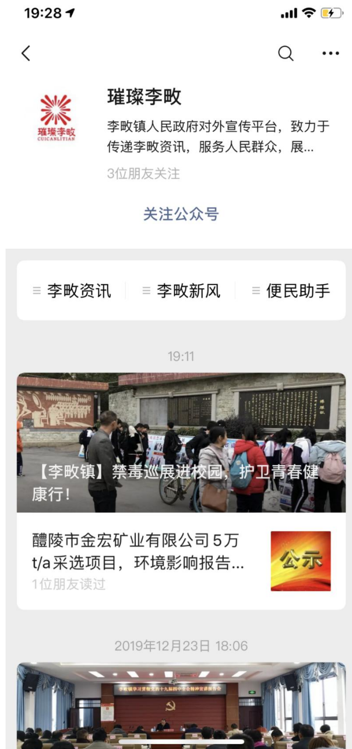
图 2 征求意见稿网络公示截图