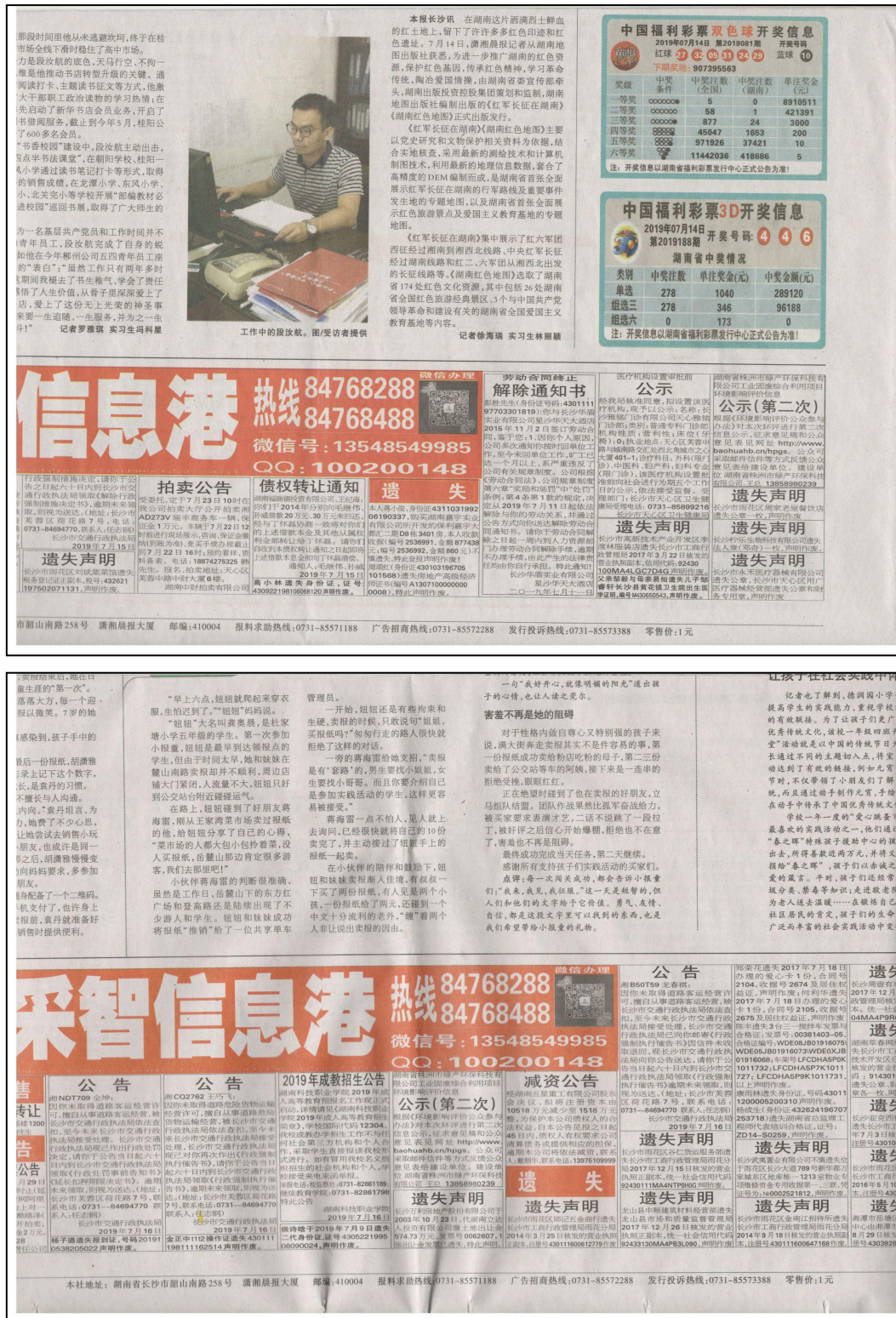
图4 第二次信息公示截图（报纸）

我公司于2019年7月15日和2019年7月16日分别在《潇湘晨报》上进行了第二次环境影响评价信息公示，详见图4。