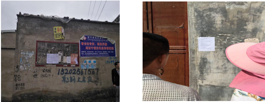
图 5 第二次环境影响评价信息公示照片（现场张贴）

2019 年 7 月 17 日，我公司在项目所在地周边村镇张贴了第二次环境影响信息公示并发布了征求意见稿的获取方式和公众参与调查表格，见图 5。