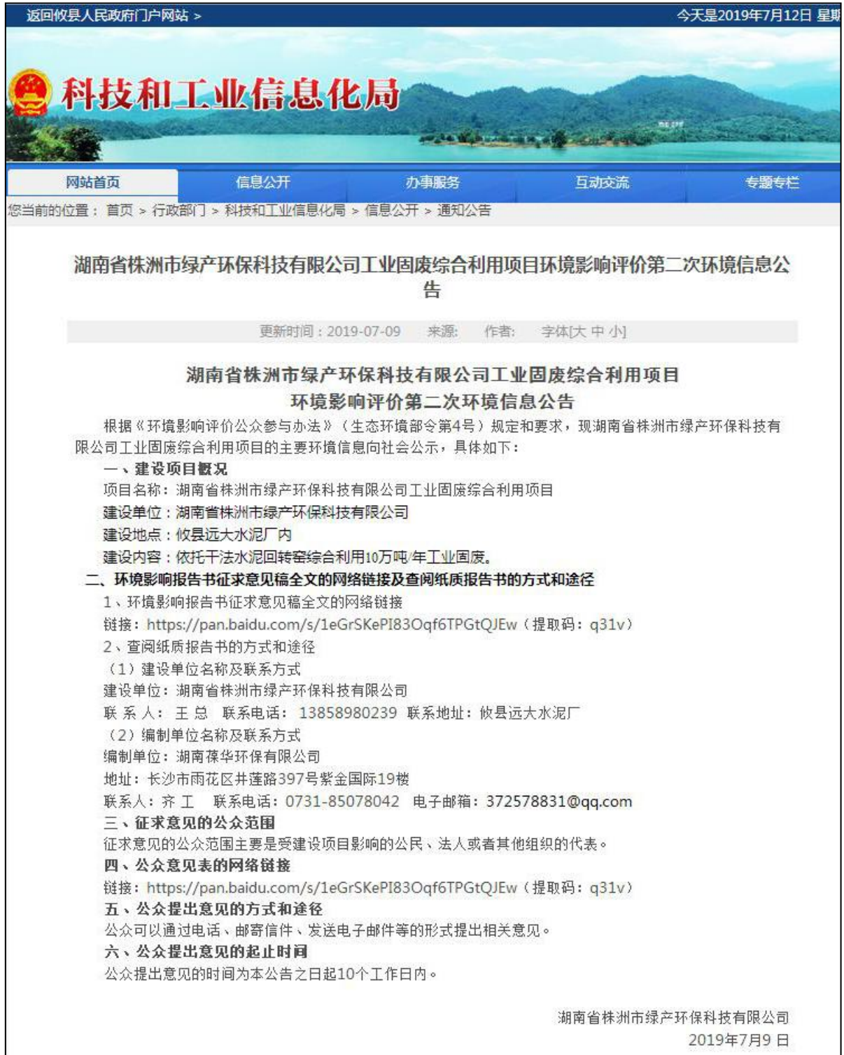
图 2 第二次网络公示截图（当地政府网站）

我公司于 2019 年 7 月 9 日在攸县科技和工业信息化局网站上进行了第二次网上公示（见图 2，网址： http://www.hnyx.gov.cn/c6066/20190709/i911977.html ）。