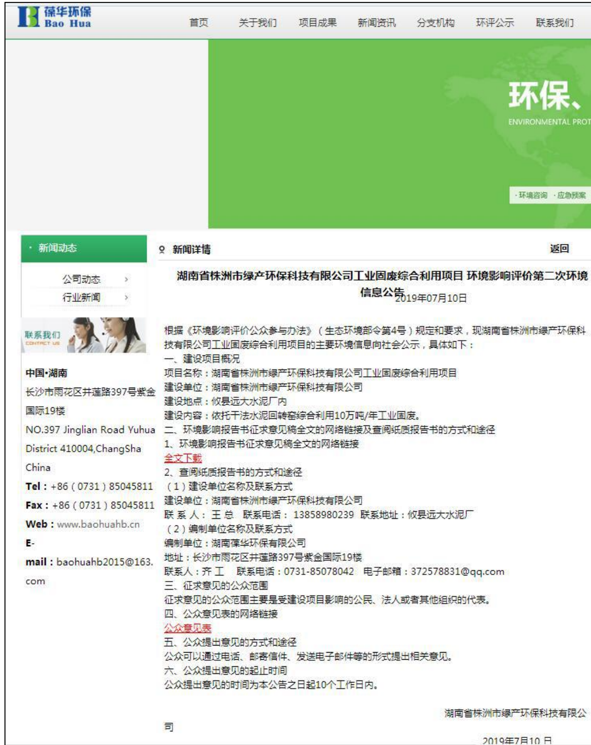
图3 第二次网络公示截图（评价公司网站）

我公司于 2019 年 7 月 10 日在评价单位湖南葆华环保科技有限公司网站上进行了第二次网上公示（见图 3，网址： http://www.baohuahb.cn/newsitem/278176194 ）。